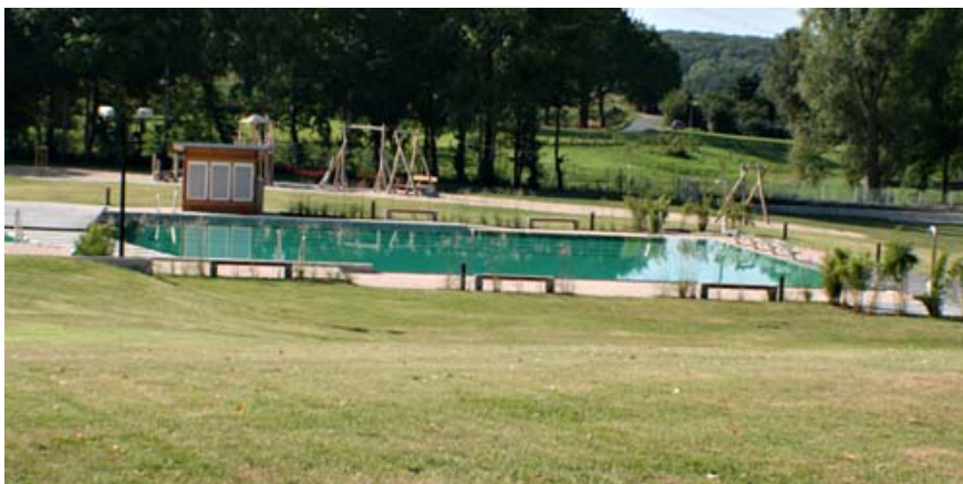
Naturfreibad Froschloch mit einer großen Liegewiese