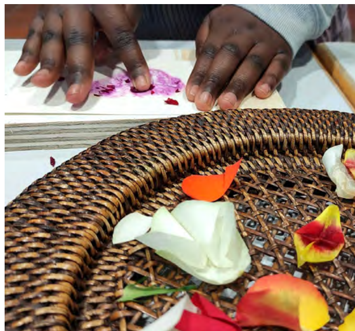
mondos Atelier: Blütendruck und Blütenmalerei

Das mondo mio! liegt im Westfalenpark und kann nach kostenpflichtigem Eintritt in den Park gratis besucht werden.