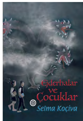
Buchcover "Die Drachen und die Kinder"

Sie hat sich dem Schreiben gewidmet, um eigene Erfahrungen für andere greifbar zu machen und sieht in der Literatur die Möglichkeit, eine Verbindung zu anderen Kulturen herzustellen.