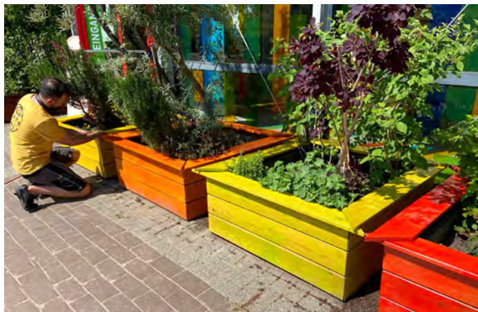
Familientag: Im Färbergarten

Wir stellen aus Blüten und Blättern Farben her und werden damit kreativ. Entdecke, welche Pflanzen zur Herstellung von Naturfarben verwendet werden und wie man mit Blüten malen kann.