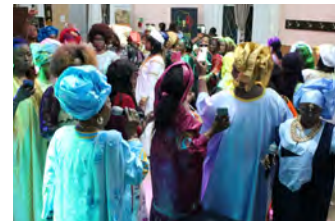
Kulturelles Familientreffen 2023 in Dortmund

Das Motto des diesjährigen Kulturellen Familientreffens, an dem viele verschiedene Speaker*innen verschiedener afrikanischer Nationalitäten mit und ohne Integrationsgeschichte teilnehmen werden, lautet „Umweltschutz vor Ort – afrikanisch-stämmige Frauen mischen mit“.