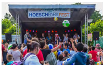
Hoeschparkfest 2016

Das bunte Bühnenprogramm bietet Livemusik für jeden Geschmack: südamerikanische Klänge, eine Cover-Band mit klassischen Hits, HipHop mit deutschen Texten. Dazu gibt es Auftritte von Tanz- und Trommelgruppen, eine Clowinnen-Gruppe sorgt für Spaß im Publikum und es gibt weitere Überraschungen.