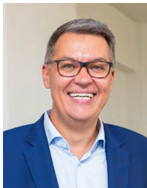
Thomas Westphal Oberbürgermeister der Stadt Dortmund