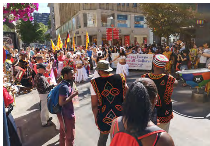
Parade der Vielfalt

Alle Tanz- und Musikgruppen, Künstler*innen und Theaterschaffende sind eingeladen, bei die Parade der Vielfalt unter dem Motto „Vielfalt in Einheit“ vom Friedensplatz über den Opernplatz via Fußgängerzone und den Dortmunder Hauptbahnhof bis zum Dietrich-Keuning-Haus mitzulaufen. Musik und Tanz bringen diese Vielfalt zusammen. Wir wollen mit Respekt und gegenseitiger Wertschätzung zusammen feiern und die kulturelle Diversität in die Mitte unsere Gesellschaft bringen.